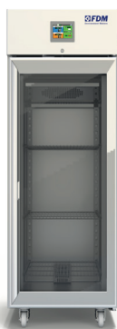
T700BXPRO PV101 + RT100